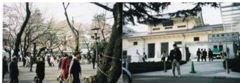
※靖国神社、遊就館前（元フコク生命本社）