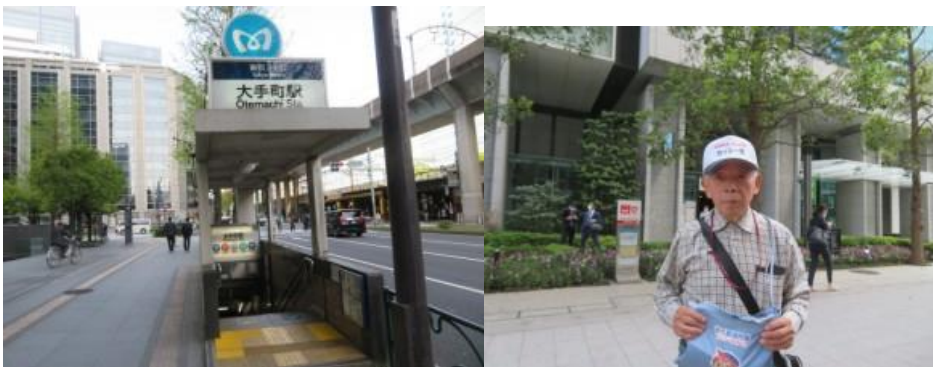
※大手町駅、読売新聞本社前