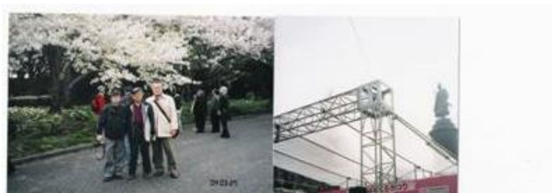
※皇居、靖国神社（大村益次郎前）

永代橋の通りを中心に進み、水天宮駅に向かう。途中迷いそうになった箇所が多々あったが、無事水天宮駅には 12 時半頃到着することができた。水天宮まで足を運びお参りする。この駅の近郊の松竹庵で昼食。交番で人気のある店と聞いただけあり、客が多数いた。1 時間程度の休息で、三越駅前を目指す。日銀、三井住友銀行の隣を通る。日銀の社殿では植樹祭が行なわれていた。皇居東御苑を初めて入園する。整理券のような入園票を入口でもらい、出口で返す。人数の検証をしているのであろう。広大な敷地に、天城吉野の桜があり、目の鑑賞にとってもよかった。北の丸公園、靖国神社でも桜観賞。靖国神社の遊就館を背景に記念写真。昭和 55 年 2 月頃までここにフコク生命の本社があり、社前で昼休み時間にバレーボール大会をした等の懐かしい記憶が蘇って来る。16 時にアップ。小休止して、飯田橋から市ヶ谷にかけて JR 線に沿って続く桜並木土手を通り、神楽坂のエミール（幹事会）までウォーキング。この土手は、独身時代余丁町に住んでいたこともあり、会社への往復この通りを歩いたものである。幹事会の懇親会にも出席した関係で、自宅着は 23 時 55 分となる。本日の営業距離は 10.1Km、万歩計は 43,935 歩だった。