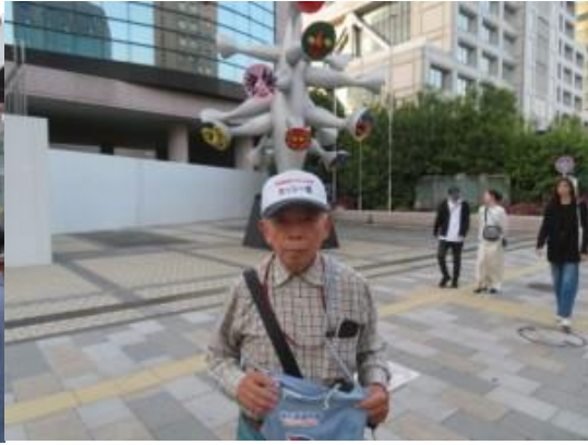
※表参道駅、こどもの樹前