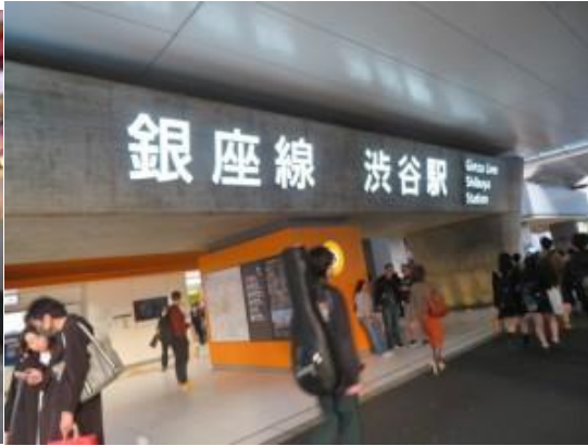
※渋谷駅への路、渋谷駅