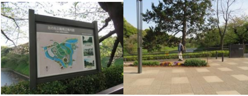
※北の丸公園、千鳥ヶ淵緑道