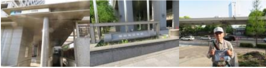
※永田町駅、都道府県会館、永田町駅界限

⑦16時41分、豊川稲荷前を通過。ここから、国道246号に沿って青山一丁目駅（16時55分）があった。17時5分、銀座線の外苑前駅があった。この駅の界限にもお世話になっているヨシダ・アンドカンパニーの事務所があった。自分が想定しない反対方向に事務所があったので驚いた。17時20分、表参道駅を通過。少し歩いた先に岡本太郎の作品（こどもの樹）があった。道玄坂通り方面を歩き、渋谷駅には17時41分到着。