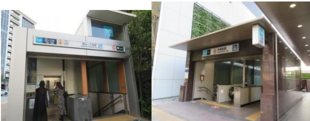
※青山一丁目駅、外苑前駅