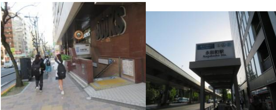
※永田町駅への路、永田町駅

⑥昨年から利用させてもらっているサンマルクカフェ前を經由し、永田町駅を目指す。エスカレーターを上がると国立劇場の看板があった。その看板と反対方向に進んだ先に永田町駅（16時23分）があった。近くに都道府県会館があった。この駅は東京香川県人会や皇居ランで何度も下車した駅であったので懐かしくなった。