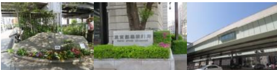
※鎧橋、東京証券取引所、日本橋

②ここから三越前壁への道筋に苦労する。誤って、13時32分、105歩ある鎧橋方向に進行していた。近くに山王日枝神社があった。何人ものお世話になり、やっと見覚えのある三越前駅（13時50分）に到着できる。本日は全く勉強せずにまた地下鉄路線図をインプットせずに臨んだのが大失敗であった。千代田線や丸ノ内線などと異なり、半蔵門線はメイン道路下に線路が少なく、くねくねした道筋の下にあったので、踏破に苦労の連続であった。しかし、往来で出会った人のお陰でこれから立ち寄る駅舎をすべてクリアできる。