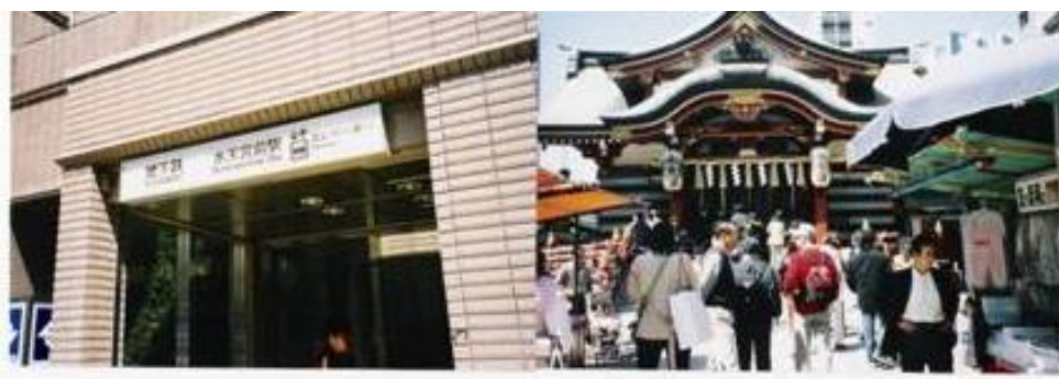
※水天宮前駅、水天宮