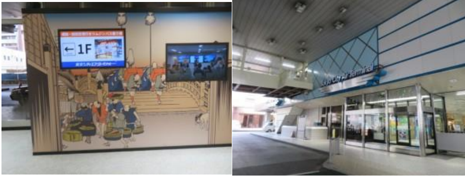
※東京シティターミナル